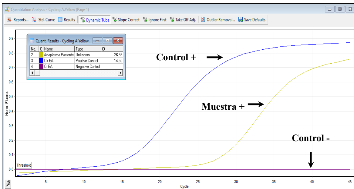
Imagen 2. Curvas de amplificación esperadas canal yellow (HEX).

La interpretación debe realizarse a criterio del investigador en base al umbral establecido, acorde al termociclador empleado además de otras variables dentro del protocolo experimental (Tabla 4).