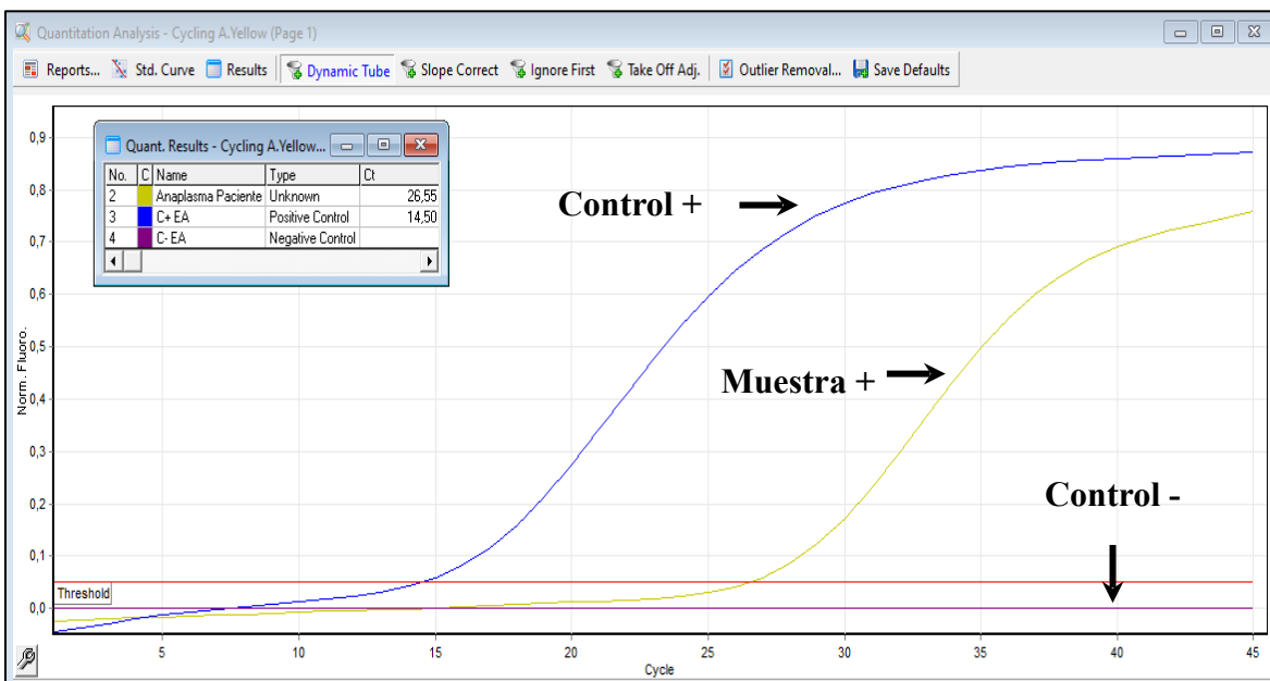
Imagen 2. Curvas de amplificación esperadas canal yellow (HEX).

La interpretación debe realizarse a criterio del investigador en base al umbral establecido, acorde al termociclador empleado además de otras variables dentro del protocolo experimental (Tabla 4).